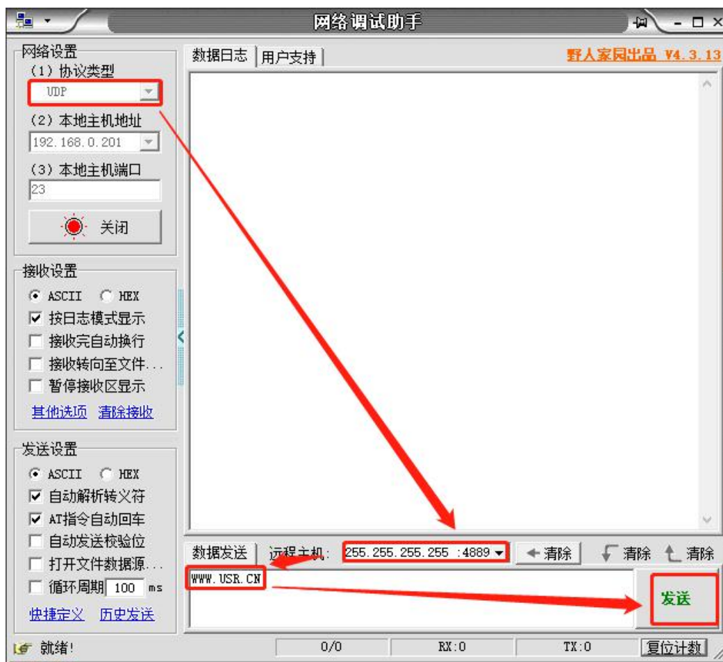
图 1 准备进入网络 AT 模式

通过网口 UDP 广播发送向端口 48899(远程主机设置为 255.255.255.255:48899)发送 WWW.USR.CN，如果模块和电脑在同一网段内，则会收到模块回复的信息。