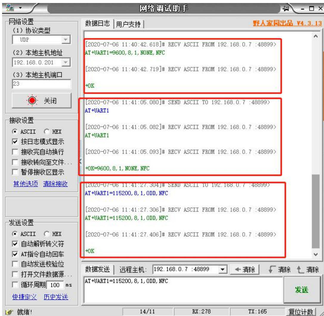
图 3 网络 AT 指令设置和查询