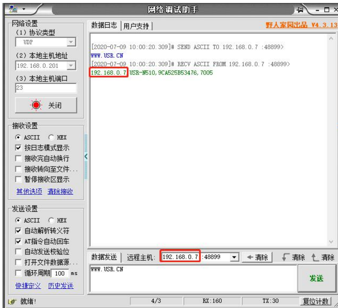
图 2 已进入网络 AT 模式

此时表明模块已经进入网络 AT 指令模式，如果挂载多个设备，使用广播会有多个设备同时回应，此时只需要修改远程主机 IP，与自己的设备 IP 保持一致。