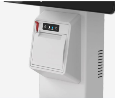
一体化嵌入式58mm热敏打印机,操作方便.