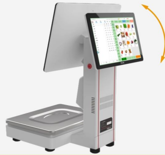
屏幕可上下调节角度, 满足不同人群需求,多重视觉角度.