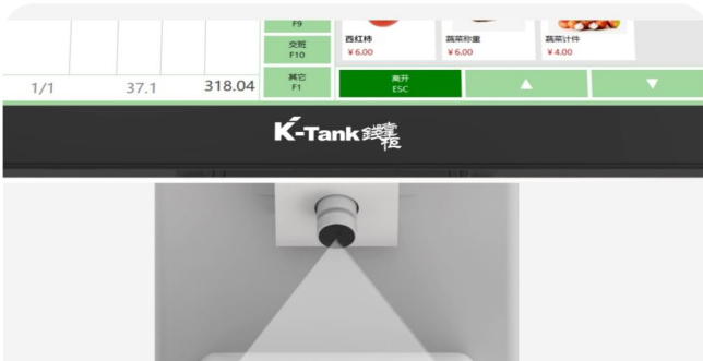
AI智能快速识别,省去繁琐称重流程, 加快打秤速度,节省人工成本.