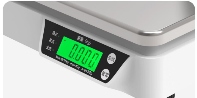
重量显示模块,去皮、清零功能, 称重信息一目了然,便于核验.