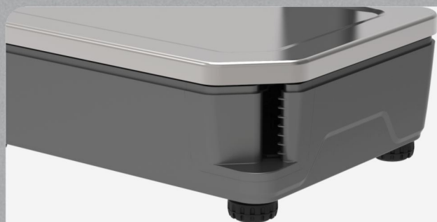
热敏标签打印机,工业级打印头,稳定可靠