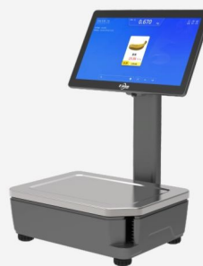
模组化设计,整机一体化