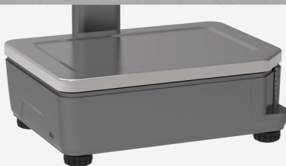
秤盘耐指纹面板厚实耐腐蚀,防刮易清洁