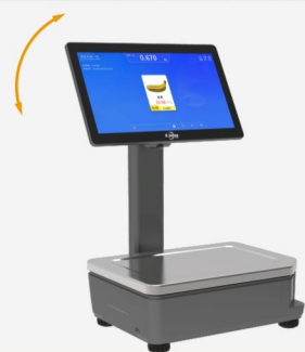
多角度灵活调节屏幕