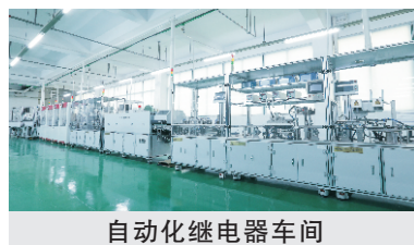
自动化继电器车间